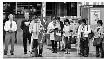
各職場から集まり、意思統一（瀬戸市職労）