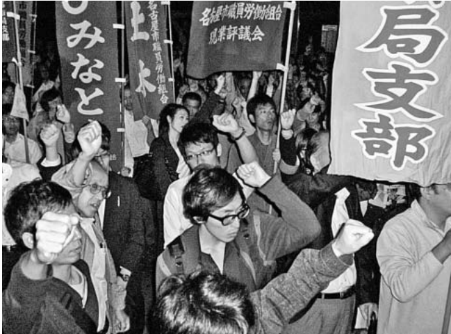
1500人が団結ガンバロウ！（名古屋ブロック）