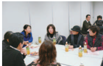
要求前進へ交流(名古屋)

豊橋市職労は12月13日、嘱託職員連絡会準備会を開催しました。準備会は、この間の団体