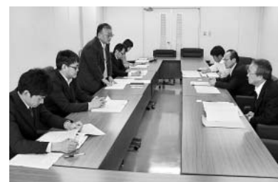
幸田町へ要請するキャラバン隊