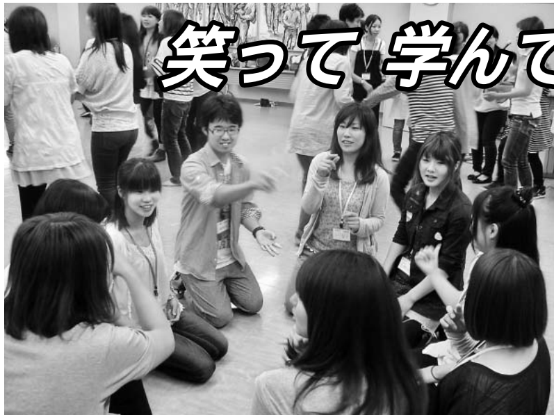
みんな輪になって保育で使える遊びを練習中