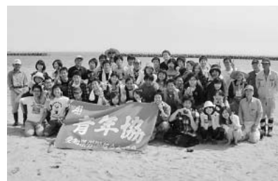
浜辺に集まりみんなでピース

5月19日、愛労連青年協主催の「新歓地引き網バスツアー」が、知多半島の山海海岸で行われ、自治労連からは青年部を中心に19人が参加しました。 地引き網は、みんなが力を合わせて網を引き、大漁。今回ツアーに参加して、他職種の方々と交流を深め