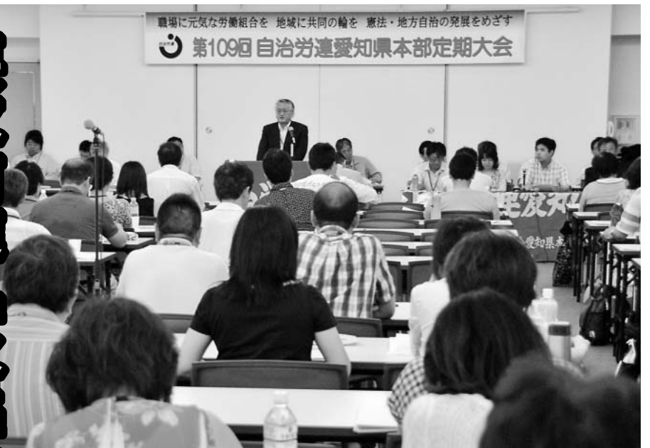
職場に元気の労働組合を 地域に共同の輪を 憲法・地方自治の発展をめざす 第109回自治労連愛知県本部定期大会

が一体となつてすすめる。③金持ち・大企業から応分の負担を求める税制改革と、社会保障の拡充、安全安心な自治体・公務公共業務の確立をめざす。同時に予算・政策闘争と人員闘争を連動させながら住民とともにすすめる。など運動の基本方向について提起されました。全体討論では29人の代議員から、「署名を集め、医療相談員の増員を勝ちとつた」(豊橋市職労)、「青年部が組織強化に尽力し、新規採用者の全員組合