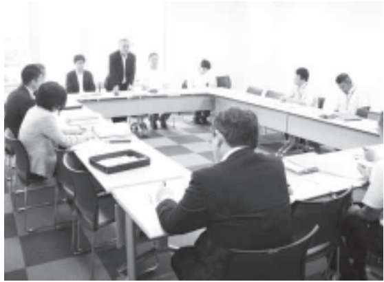
犬山市で懇談する自治体キャラバン隊