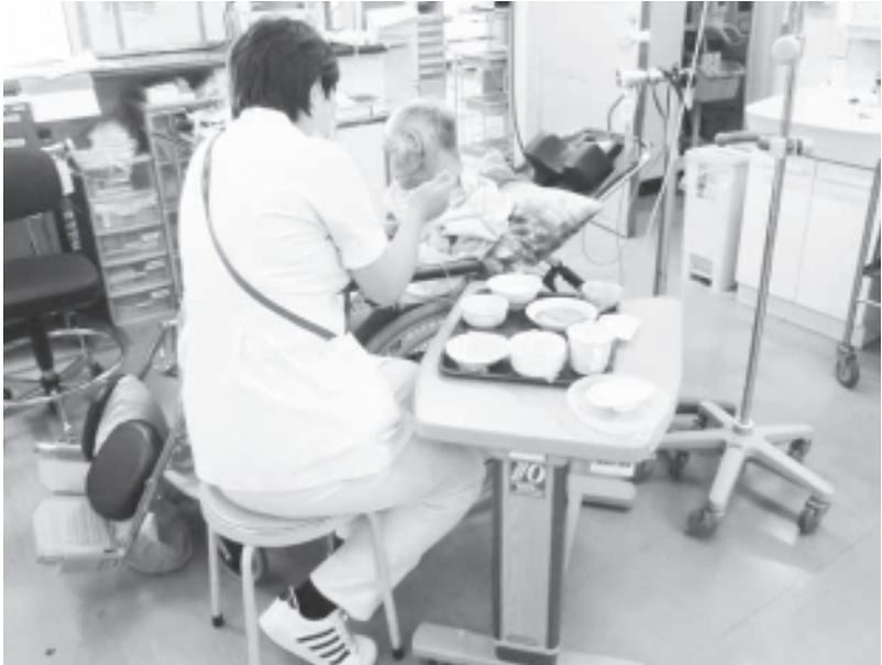
食事介助を行う療務員 配膳からスプーンを使って食事の補助まで行います

半田市職病院支部では、職場の悩みや課題の解決に向けて、日々奮闘しています。患者の身の回りの世話をする療務員（半田病院では看護師の補助的な業務を行う看護助手のことを“療務員”と呼ぶ）の外部委託を病院の直雇用に戻し、今年4月には時給制を月給制に変更させ、賃金の大幅改善を実現しています。半田病院で働く療務員さんに職場と組合についてお話を伺いました。