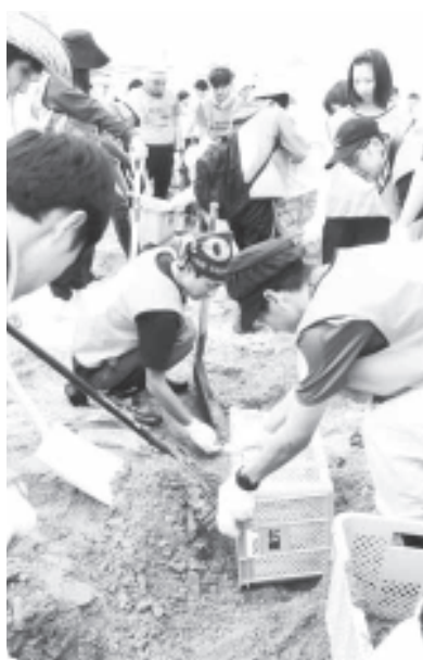
砂浜の小さな瓦礫を取り除きます

豊橋市職労は、6月21日から23日にかけて、西尾市職の2人を含む31人の参加で宮城県南三陸町で東北復興支援ボランティア活動を行いました。東日本大震災の被災地と、その被災地で働く仲間を激励しようと、今回南三陸町に派遣されている豊