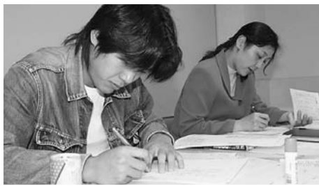
昨年の実践講座参加者

あなたも参加しませんか 第9回あいち機関紙宣伝学校 愛労連と自治労連がとりくむ第9回機関紙・宣伝学校が開催されます。読まれる、待たれる新聞や効果的な宣伝物作成をめざして学習します。ぜひ、職場、