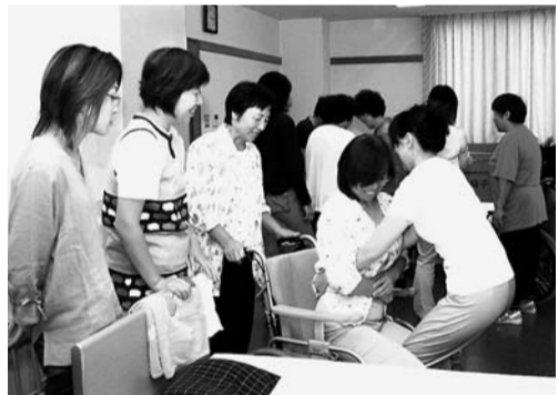
介護実技の基本を学ぶヘルパーさんたち

9月12日(日)、名古屋に働くホームヘルパーのつどい、が労働会館本館で開催され、名古屋市内及び周辺市町から120人近いヘルパーやケアマネなどが参加しました。このつどいは名古屋市内職労やなごや介護福祉労組を中心に実行委員会で開催したものです。