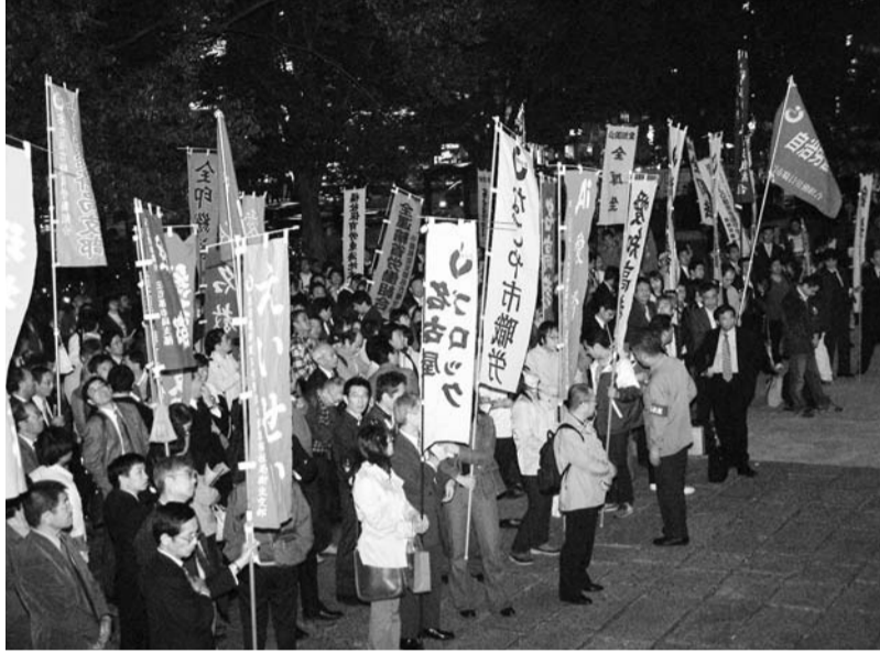
官民労働者一緒の集会は今年で3回目