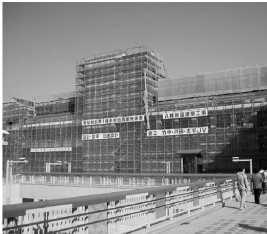
有松駅前に巨大なビル建設！ 地元商店街の切り捨てで街は どうなるの？

革新市政の会は11月6日、バスによる市政ウォッチングにとりくみ37人が参加しました。この取り組みは、松原市政の問題点を大型公共事業を中心に検証し、市政のあり方を考えるもので、市内南部地域を視察しました。