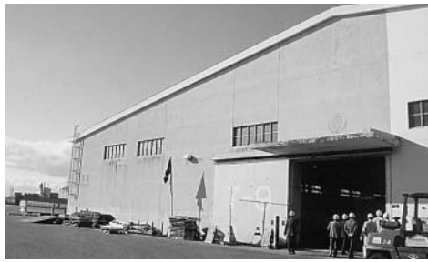
名古屋港金城ふ頭7号上屋（外観）

「過去の輸入の詳細なデータ」の公表、愛知労働局へ「健康管理手帳の交付と健康診断の全額国庫負担」を求める要請も行いました。