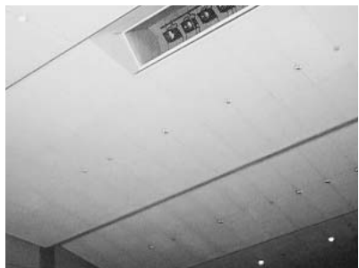
名古屋港湾会館大ホール（天井の奥に密封）

名古屋港管理組合の関係施設でアスベストが使用されている現場調査パトロールとして、最初に旧名古屋港観光案内所を訪れ、天井部分に吹き付けられたアスベストを調査。現在はこの施設は使用禁止となっているそうです。続いて名古屋港港湾会館の大ホールを見学し、天井部分と天井裏で密封状態にも使用されていることがわかりました。最後に調査した金城ふ頭7号上屋には今も天井部分にアス