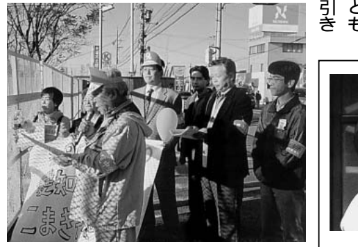
フェンス越しに自衛隊小牧基地へ要請する代表団

集会後自衛隊小牧基地までパレードし、小牧基地関係者に、小牧基地強化や米軍の使用に反対する要請を行いました。