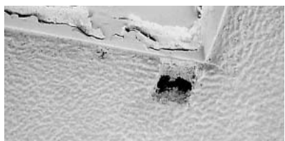
旧名古屋港観光案内所・天井（写真中央の黒い部分にアスベストが使用）

ベストが使用されており、今後の対応を検討中であることが説明されました。今回調査した現場の粉じん濃度は、大気汚染防止法