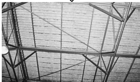
天井一面に白く見えるのが石綿（室内）

名古屋港では、1970年代から80年代にかけてアスベスト原料そのものの荷役に携わった港湾労働者が数多くいます。「純生」アスベスト粉末の暴露を受けている可能性が危惧され、2人の労働者が労災認定を受けています。みなと総行動では、名古屋港運協会へ「労使によるアスベスト対策委員会の設置」、名古屋税関