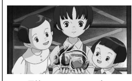
長編アニメーション映画