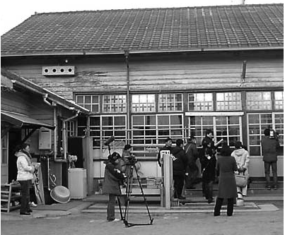
開設70年の則武保育園

「名古屋の公立保育園を守る う!」名古屋市立則武(のりた け)保育園(1935年開設)の 廃園・民営化にストップをかけよ うと2月10日夜、昭和区で集会を 開きました。保育園の父母や名古屋 市職労はじめ保育園体などが開 いたもので会場満員の700人の 参加者が集まり、みんなの力で公 的保育を守ろうとアピールを採択 しました。