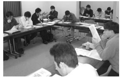
憲法を自分のことばで語ろうと学習会がスタート

勤労者通信大学の憲法特別コースの受講生は、豊橋で現在32名です。青年部が10名、教育支部8名、環境