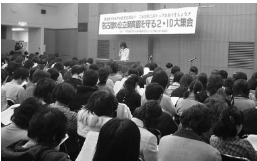
公的保育を守ろうと700人がつめかけました