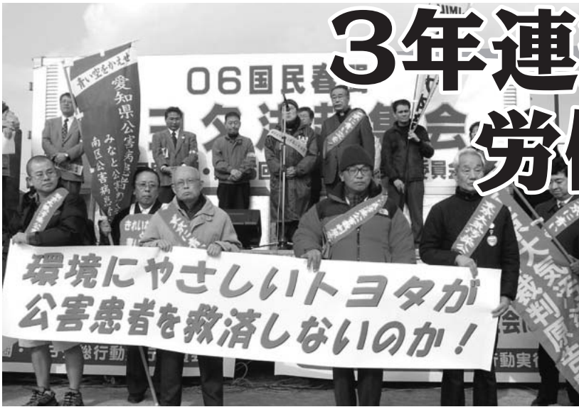
トヨタのディーゼルガス排出による公害裁判原告団100人も東京から参加