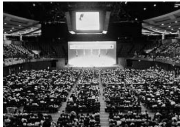
開会総会の会場は人でいっぱい

役員・書記3～4年目までのみなさんふるって参加を とき・9月13日(土)～14日(日) ばしょ・犬山市・レークサイド入鹿