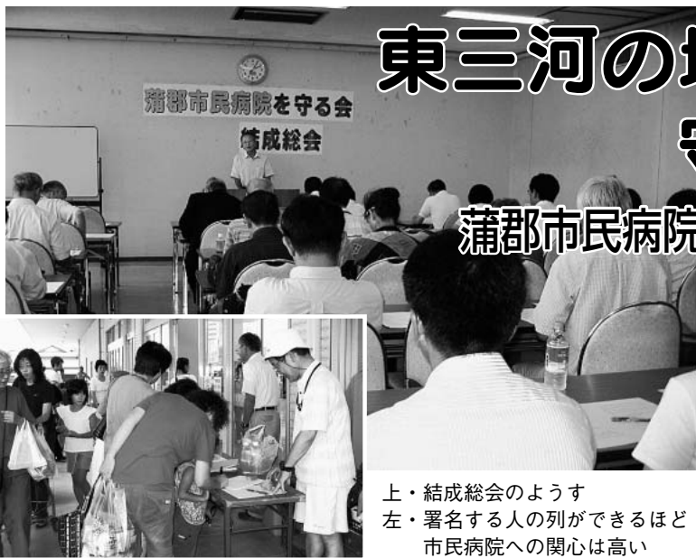
結成総会のような列ができるほど 署名する人の関心は高い 市民病院への

最低賃金を2012年度までに小規模事業所の「高卒初任給の最も低い賃金」を目安に引き上げることなどで合意しています。にもかかわらず、現実には生活保護以下の水準での改定になっており、私たちが求めている「せめて時給は1000円以上」の改定は、すべての労働者の賃金の底上げにとって、重要な課題です。 8月7日には、「生活実態に合う改定を」と、愛労