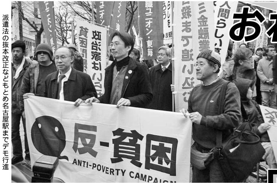
派遣法の抜本改正などとも名古屋駅までデモ行進