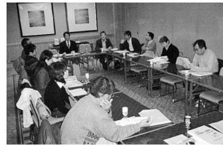
分科会では熱心な討論が

その後、昨年のたたかいでパート労働者を組合に連れ雇用を守った岩倉市職、90%以上の組合員が参加しとりくまれた西尾市職の本庁職場オリーブの報告、1400名中1070名の組合員が自治労連共済に加入している名古屋 市職労働環境局支部の教訓などが報告されました。組織集会の基調報告では、4月から6月末までとりくまれる春の組織拡大月間で、新規採用者の組織化に向け、同年齢や配属先の組合員から組合加入への訴えを行う。職場組合員の「つぶやき」を大切に組合運営を行う。そのために、支部や課単位での分会活動をすすめようと提起されました。 翌日は、未加入者対策や、本庁職場での組織拡大と職場からの組合活動をどうすすめるのか、非正規労働者の組合員化を思い切つてすすめて、分科会に分かれて話し合いが行われました。