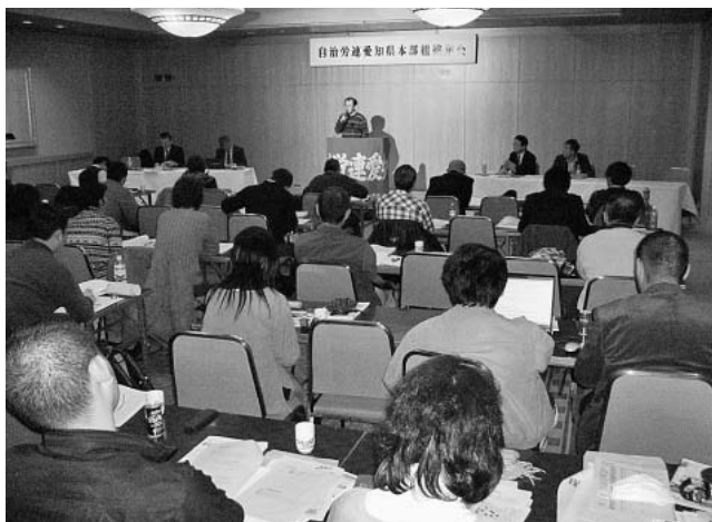
単組の特別報告にききいる参加者

向上に努めるために組合は要求しなければならぬ」と、攻勢的なたたかいをすすめようと提起しました。 また労働相談の実践例として、有給休暇は申し出たときに、その特定日の就労義務がなくなる*「形成権」であると語りました。 *単独の意思表示のみで