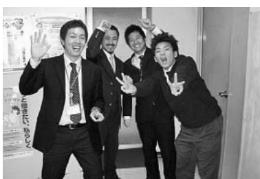
おきプロ成功へ奮闘する4人の青年