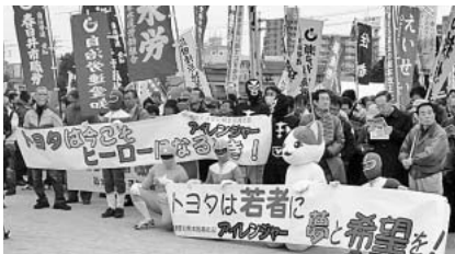
世界のトヨタに物申す

愛労連など実行委員会 が主催する「第30回トヨタ総行動」が豊田市内で 開催され、1600人が 参加しました。はじめに