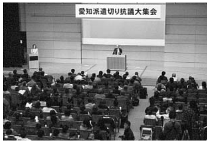
大企業の横暴などが告発された集会① と参加者のむしる旗②