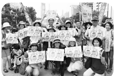
「戦争やめて!」とアピールする愛知の仲間

いで欲しい」という願いを込め、組合員みんなで折った千羽鶴を届けています。8月13日、名古屋港水族館前で核兵器廃絶の署名宣伝行動を実施しました。お昼休憩にもかかわらず10名が参加。子ども連れの家族へ「平和を求めろみんなの声を集め核廃絶を訴えよう」と呼びかけ、署名32筆を集めています。