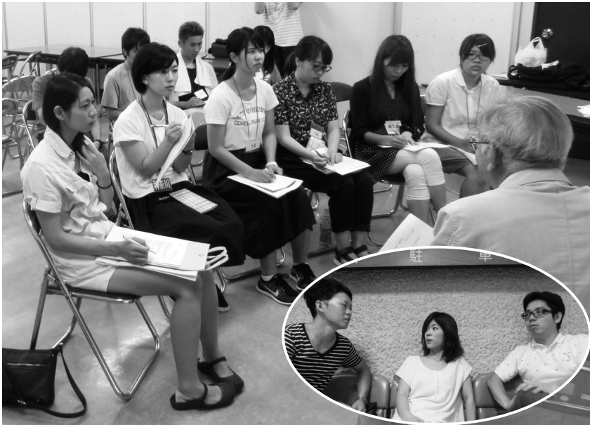
被ばく者の実体験を聞く原水禁の参加者 / 原水禁の感想を語る愛知の参加者(右下)

今年の8月で戦後70年を迎えました。今、政府は、70年間不戦を貫いてきた日本を「戦争する国」へとつくりかえようとしています。これに対して、自治労連は「憲法と平和を守る」とりくみをすすめています。8月7日から長崎で行われた原水爆禁止世界大会と、「戦争反対」と平和を訴える県内のとりくみを取材しました。