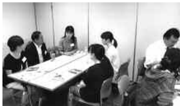
「アサーション権が信頼関係築く」と好評だったつどい

自分も相手も権利としての自己表現を尊重すること(アサーション権)や自己尊重のコミュニケーションが信頼関係を作ることを体験しました。参加者からは、「話す側だけでなく聞き手側も気を付けておくと内容が良くなることに気づけた」「職場に持ち帰り、あてはめてみたい」などの感想が寄せられました。