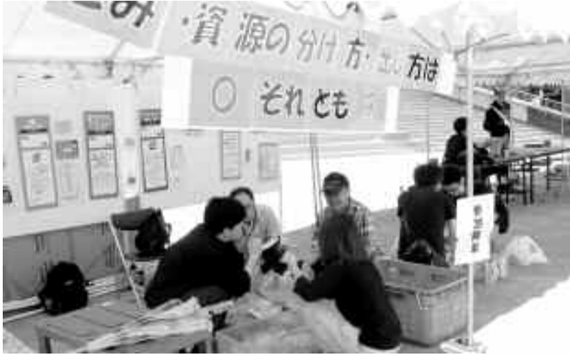
「第8回なごやかふれあいまつり」。環境局支部はごみの分別ゲームのブースを出展

日時 7月15日(土)14:00~ 場所 労働会館本館 主催 愛労連・あいち健康センター