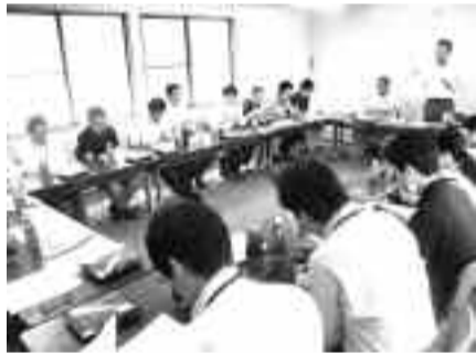
人員要求について議論する豊橋市職労

求を練り上げよう。②その上で、管理職が人事当局に提出する「減増員調査」に取組み、要求に反映させることを意志統一しました。今後6月20日の団体交渉を起点に、この夏すべての職場・分会で人員要求運動に取り組めます。他単組でも職場訪問活動などが積極的にすすめられています。