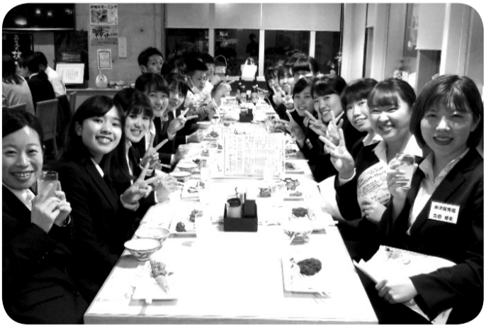
西尾市 = 4月17日