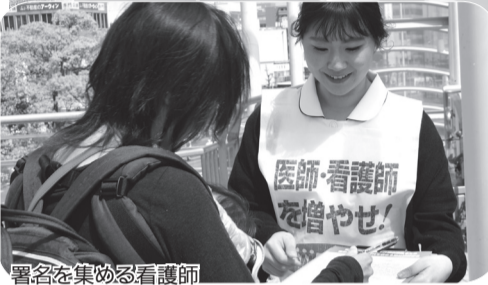
署名を集める看護師