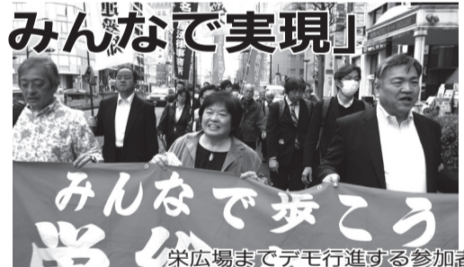
参加者でデモ行進するまで栄広場＝4月17日 大津通り

4月17日、中区周辺で「栄総行動」が行われました。さまざまなコースからデモ行進がおこなわれ、昼休み集会のあたる栄広場に約100人が集結しました。労働組合・民主団体・市民が、「みんなの要求をみんなで実現する」栄総行動は、91回目を迎えます。今年も「小中学校の統廃合反対」、「古沢公園をなくすな」、「浜岡原発は即廃炉」など、多くの要求が集まりました。集会では、三菱電機で派遣切りとたたかう女性が発言。「一方的な解雇は許さない。直接雇用を求めてねばり強くたたかっていく」と決意をのべました。