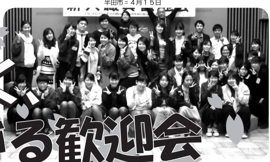
半田市 = 4月15日