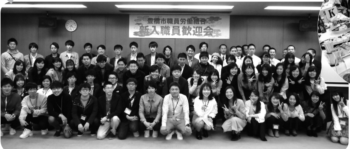
豊橋市 = 4月13日