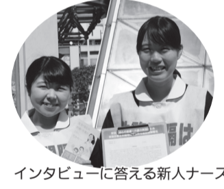
インタビューに答える新人ナース